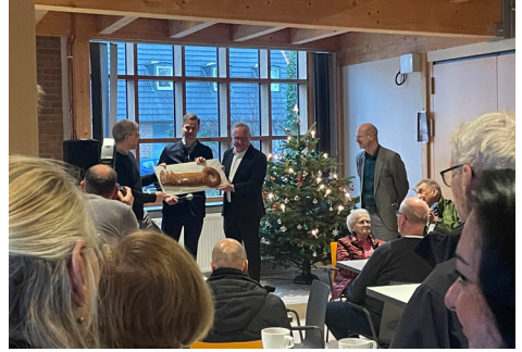
Die symbolische Schlüsselübergabe für das neue Stadtteilzentrum Windflöte.

Am Freitag, dem 8. Dezember 2023, öffneten sich die Pforten des neuen Stadtteilzentrums in der Windflöte. Vertreter*Innen der Stadt, der Diakonie, die Architekten und viele Gemeindeglieder hatten sich eingefunden, um die neuen Räume zu besichtigen und die geleistete Arbeit zu würdigen.